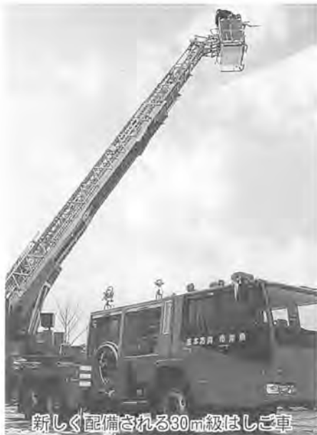
新しく配備される30m級はしご車