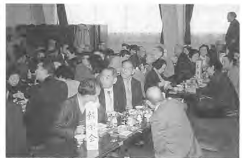
▲新年会に集まったみなさん。会員同志の交流会は定期的に行われています。

同会の会員は現在約200名。各界の講師を招いて会員同士の教養を深める、高齢者学級を月1回の割合で開催しているほか、公民館活動に合わせて他