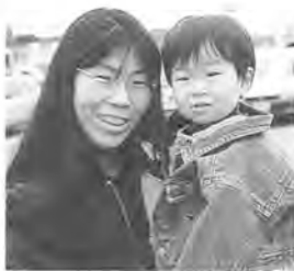
平成9年9月4日生まれ

っかりする暇があるなら、自分のご飯くらい自分で作ってみたら？」とさりげなく言われました。それでお母さんの気持ちがよくわかりました。それから1週間は、僕とお父さんが夕食を作ってあげて、その後もできるだけ手伝いをすることにしました。 家事やお茶くみなどを女性に任せないで、お互いを思いやる気持ちを持って、家庭でも職場でもお互いの能力をもっと活かせば、よりステキな社会が作れるのではないかと思います。