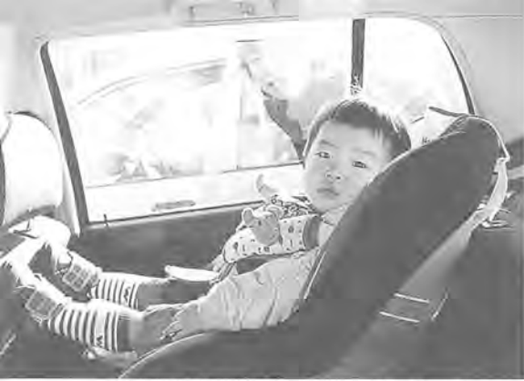
▲愛するわが子を守る、チャイルドシート。愛する地球を守るために、何かできることはないかな？