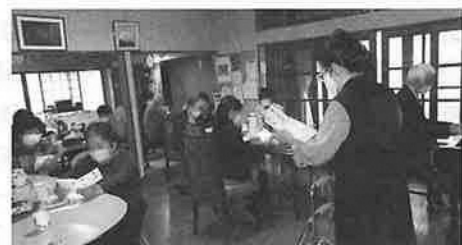
▲高齢者が集いなつかしい歌を楽しむ活動(NPO法人つむぎ)

※対象団体は、社会福祉法人、NPO法人、地域福祉団体等となります。 初めて申請される方は事前にご連絡ください。