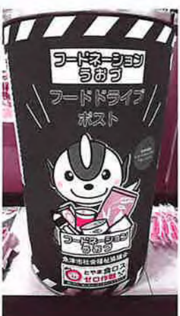
→ハロー魚津店の回収ボックス