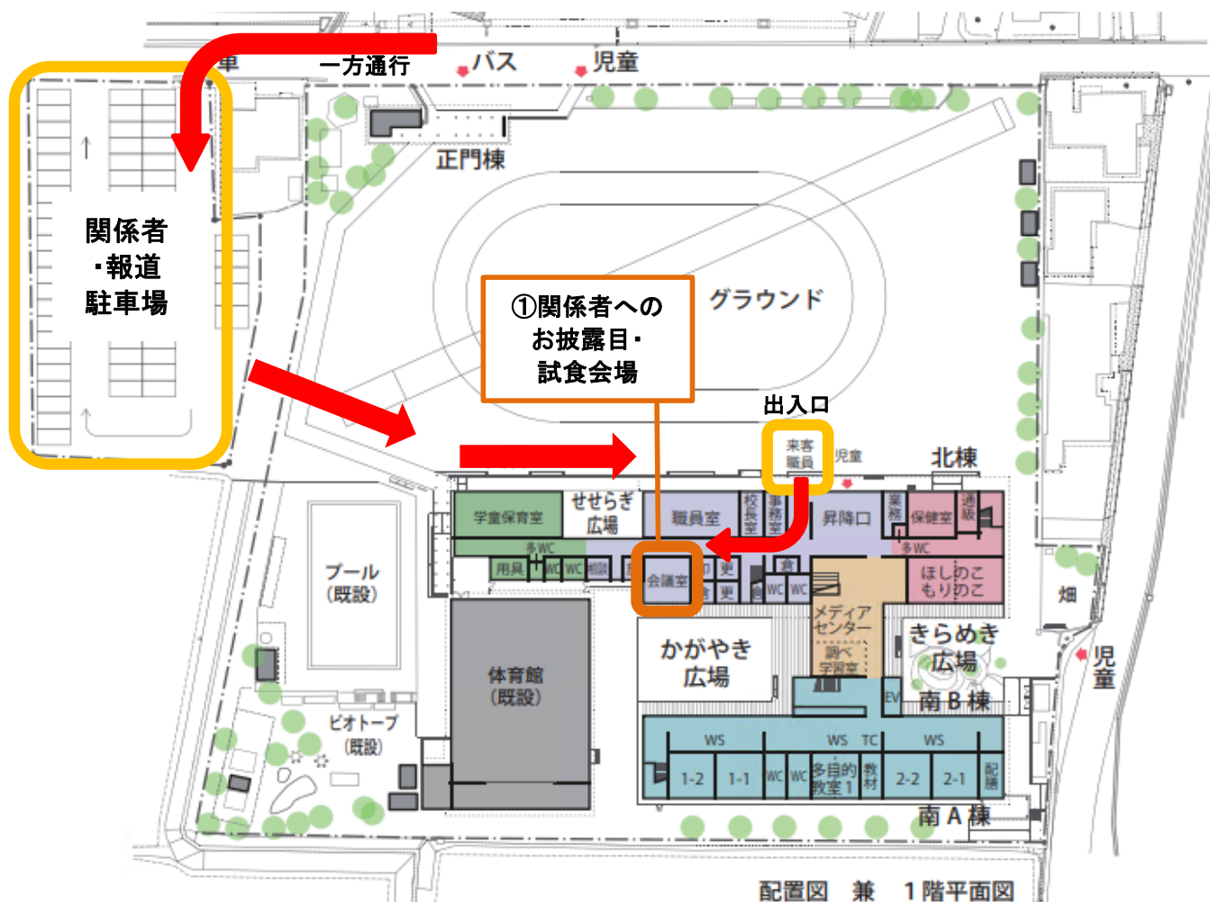
配置図 兼 1階平面図