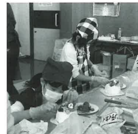
▲クリスマスケーキ作り