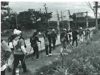
▲春季ウォーキング (天神地区)