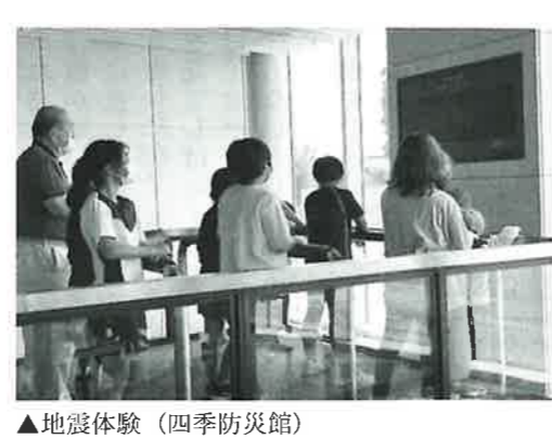
▲地震体験（四季防災館）