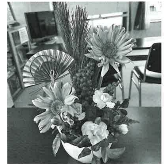
▲フラワーアレンジメント