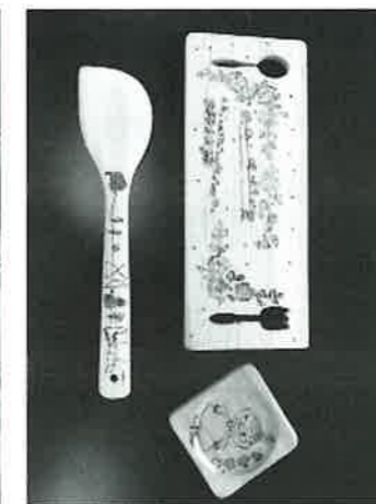
▲ウッドバーニング