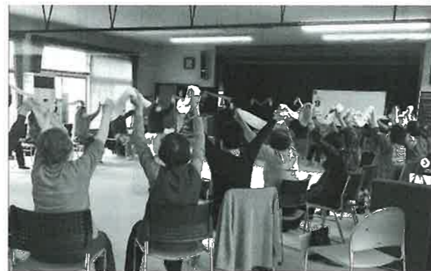
▲高齢者学級(心と体の健康づくり)