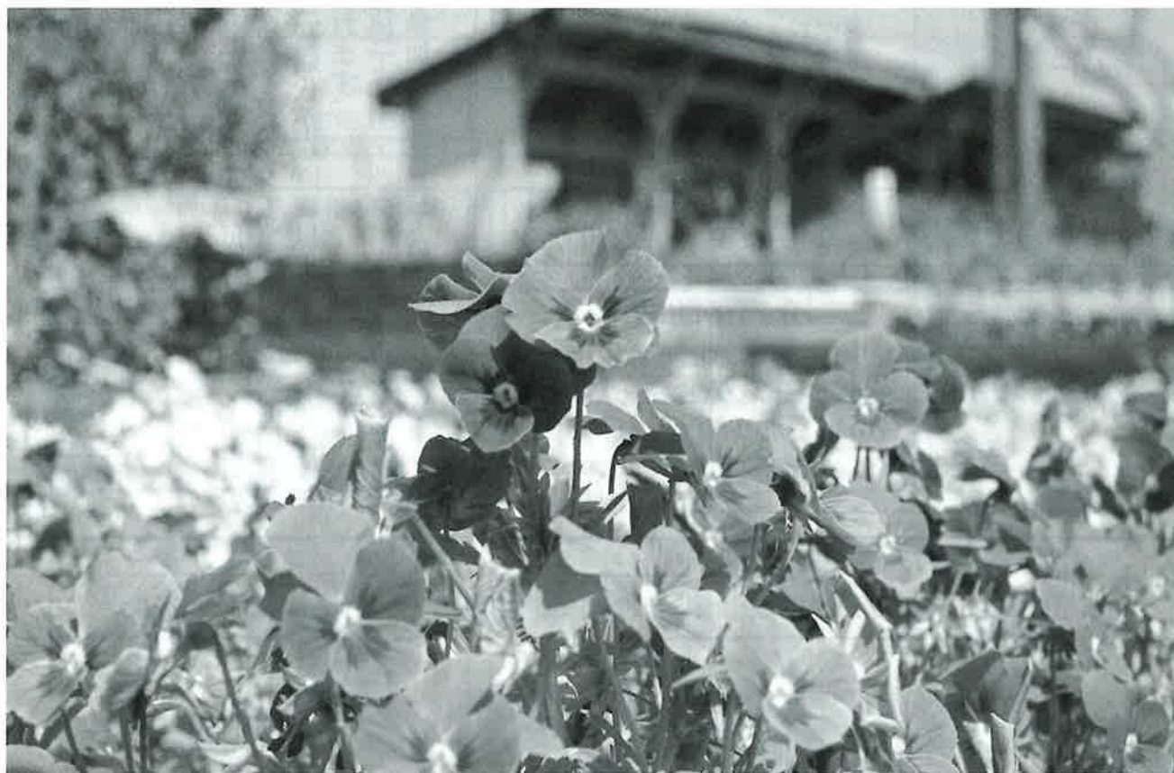
公民館の隣の花壇は、花と緑振興会の皆さんにより整備されています

発行所 経田地区振興協議会 発行責任者 野村 博 編集委員 高木 宣行 宮野 浩一 松岡 みゆき 武田 佐千代