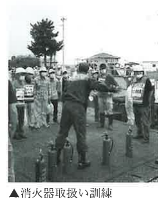
▲消火器取扱い訓練

届出避難所とは 自治会や自主防災組織等が地域の集会所等で自主的に開設する避難所のことです。市が開設する指定避難所（経田地区では経田小学校・経田公民館・魚津工業高校）とは別に地域住民の自主的な避難場所として開設されます。 魚津市では、令和4年9月から届出避難所を登録できる制度が開始されています。 届出避難所には、非常食・飲料水・毛布などの救援物資が市から事前に設置されます。期限切れの際にも更新されます。