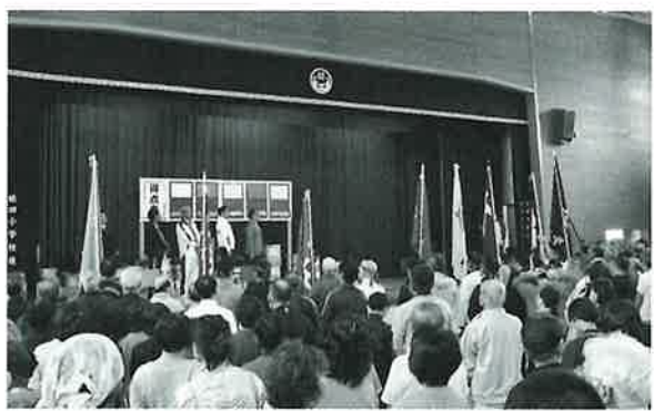
▲住民運動会 (令和元年)