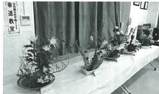
▲華道教室の作品展示(経田地区文化祭)