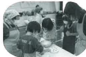
ケーキデコレーション