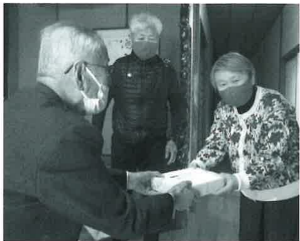
役員が記念品をお渡ししました。

例年は公民館で受賞者祝賀会を開催しているところですが、新型コロナウイルスの感染拡大防止のため、今年も個別に受賞者への記念品贈呈を行いました。受賞された皆さん、おめでとうございます。これからのますますのご活躍を祈っております。