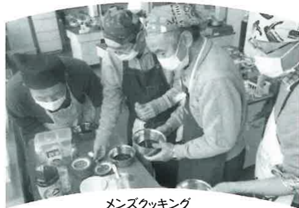
メンズクッキング

土曜教室 こどもサークル 太陽学級 気象庁出前講座 異世代交流事業 ドライフラワーリース作り 女性セミナー 手縫いの小物ペンケース作り