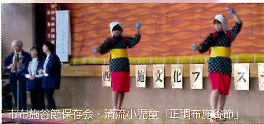
市布施谷節保存会・清流小児童「正調布施谷節」

4年ぶりに芸能の部、飲食コーナーが復活し、約260名の地区住民が集まり大変賑やかな文化フェスティバルとなりました。