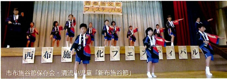
市布施谷節保存会・清流小児童「新布施谷節」