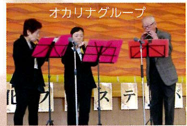
オカリナグループ