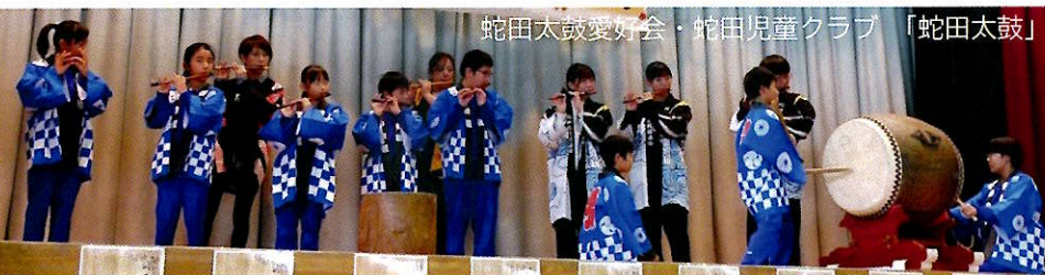
蛇田太鼓愛好会・蛇田児童クラブ「蛇田太鼓」