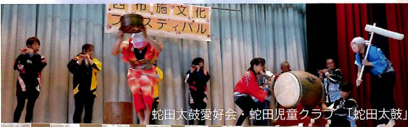
蛇田太鼓愛好会・蛇田児童クラブ「蛇田太鼓」