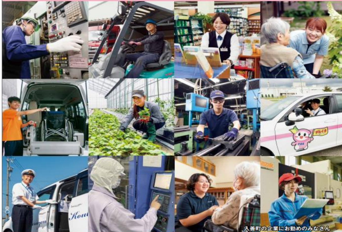
入善町の企業にお勤めのみなさん

日時 令和6年2月14日(水) ①午後2時～午後4時 (受付:午後1時30分～)