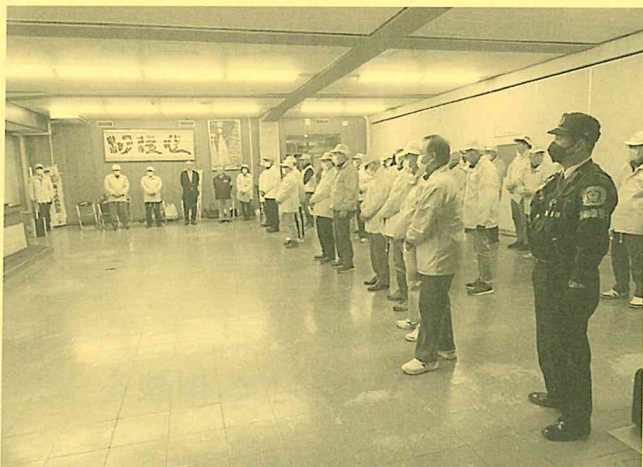
令和5年12月14日：あいの風とやま鉄道魚津駅周辺等 参加：各地区防犯組合・暴追協議会・魚津警察署等