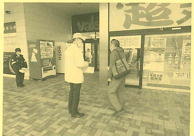
令和5年12月15日：魚津アップルヒル 参加：魚津警察署・市防犯協会