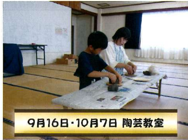
9月16日・10月7日 陶芸教室