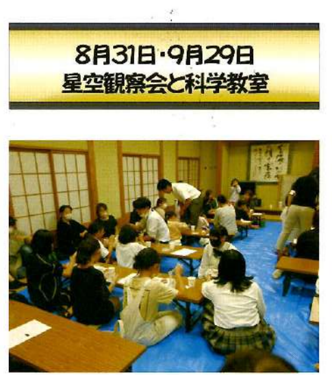
8月31日・9月29日 星空観察会と科学教室