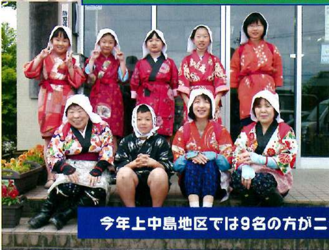
今年上中島地区では9名の方が二十歳を迎えました。おめでとうございます。

私たちの学年が今年成人という節目を迎えたことに、とても嬉しく思います。思い返すと小中学生の頃の記憶が鮮明に蘇ります。一月七日に成人式を終え四月からは社会人になります。周りの人に感謝の気持ちを忘れず自分らしく挑戦し続けたいです。