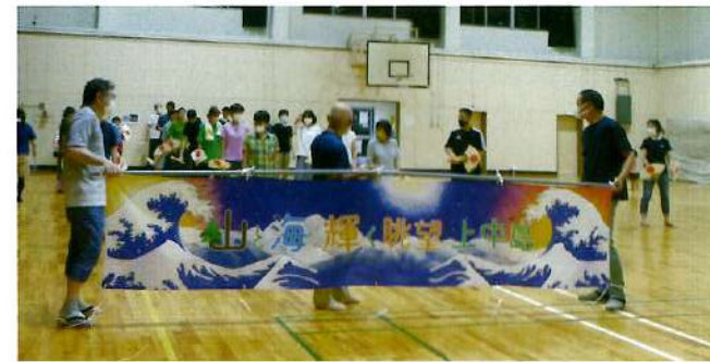
蝶六教室 小学生:7月25日(火)~ 7月31日(月)の平日 全体練習:7月5日、12日、19日、26日 (毎週水曜日)