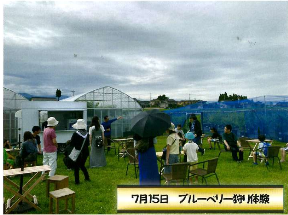
7月15日 ブルーベリー狩り体験