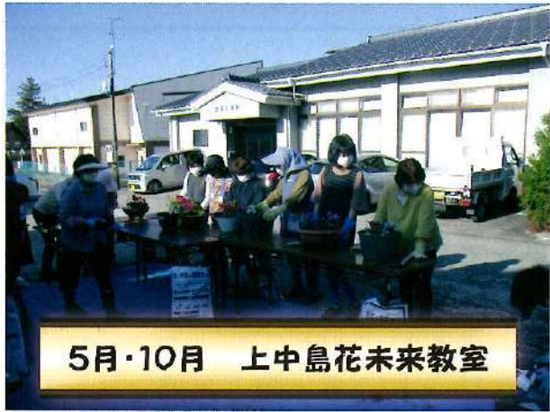
5月・10月 上中島花未来教室