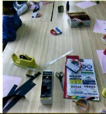
11月4日 キラキラ宝石箱づくり