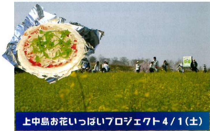
上中島お花いっぱいプロジェクト4/1(土)

ひまわり畑に植えた菜の花の種が芽を出し、イベント当日は3分咲きといったところでしたが、食べるにはちょうど良い頃合い(^^)