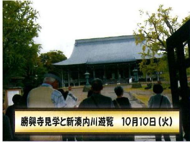
勝興寺見学と新湊内川遊覧 10月10日(火)