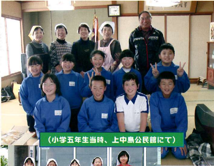
(小学五年生当時、上中島公民館にて)