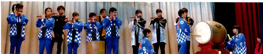
「西布施地区文化フェスティバル」で蛇田太鼓愛好会・蛇田児童クラブによる「蛇田太鼓」を披露