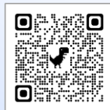
市HP 基本構想【概要版】

「魚津市新庁舎整備基本構想(案)」について、広く市民の皆様からご意見を募るため、2月5日から3月4日までの期間において、パブリックコメント（意見募集）を実施しました。ご意見があった内容等について一部修正し、 「魚津市新庁舎整備基本構想」 を策定しました。