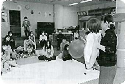
子育てサロン 秋のお楽しみ