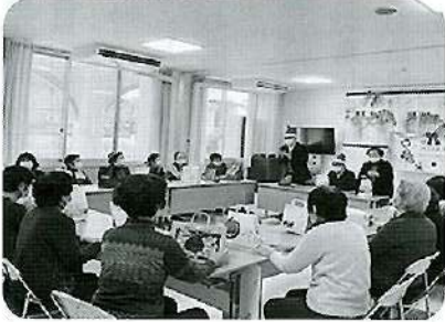
友遊の集い クリスマス会