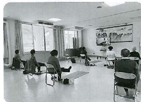
映像を見て簡単な運動をします