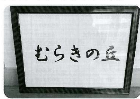
匿名希望さん 60代 「地域の皆様から親しく呼んでもらえるとしました。」