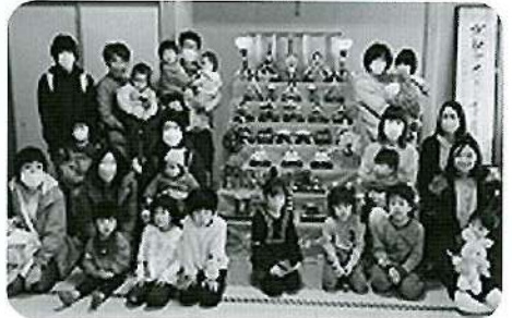
子育てサロン ひな祭り