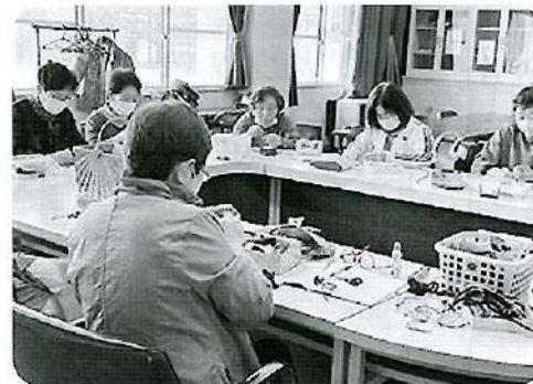
毛糸作品・手芸作品を制作します