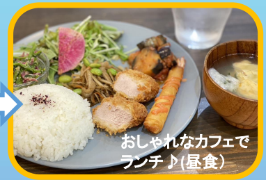
おしゃれなカフェで ランチ♪(昼食)