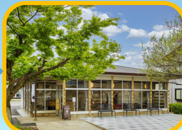
さつまいも畑見学 と工房見学！ (会社見学)