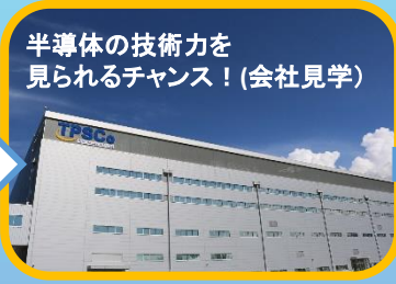
半導体の技術力を 見られるチャンス！(会社見学)