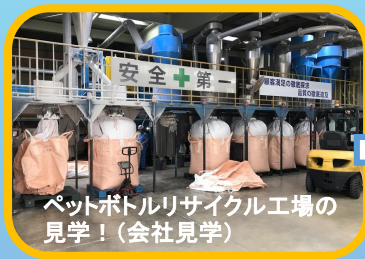
ペットボトルリサイクル工場の 見学！(会社見学)