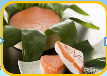
自分だけの 鱈寿司を作ろう！ (鱈寿司づくり体験)