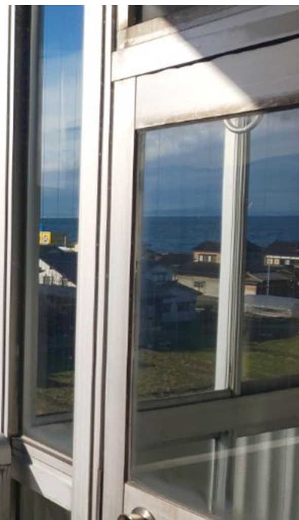
↑⑪ バランダからの眺望