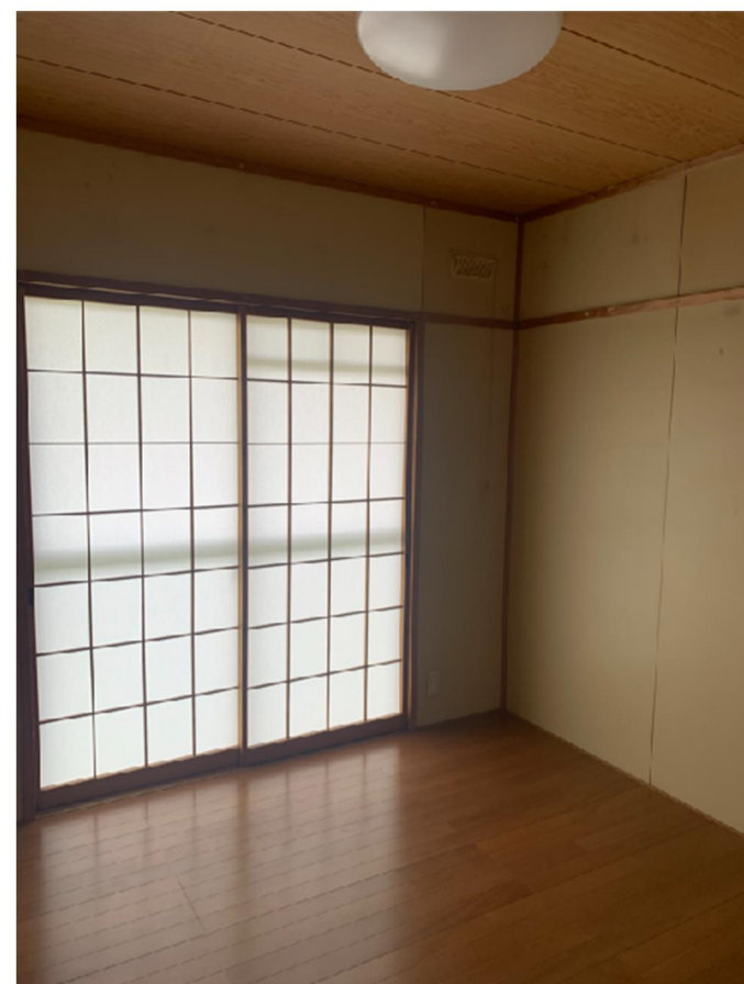
↑⑨ 洋室 2