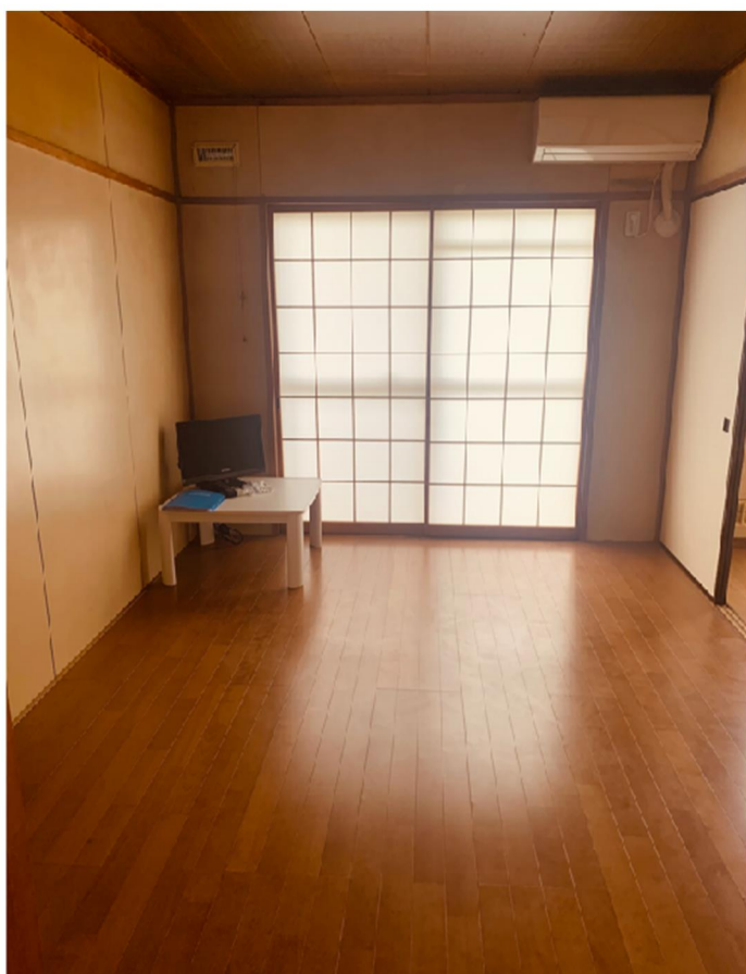
↑⑦ 洋室 1