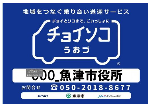
停留所イメージ（A4判）