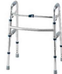
歩行器 （※歩行車は除く）

（8）貸与告示第九項に掲げる「歩行器」のうち、脚部が全て杖先ゴム等の形状となる固定式又は交互式歩行器をいい、車輪・キャスターが付いている歩行車は除く。