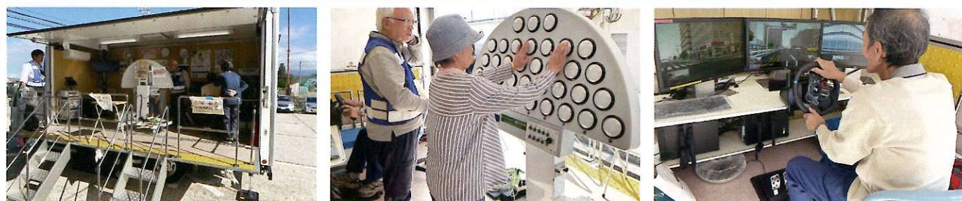
交通安全いきいき教室