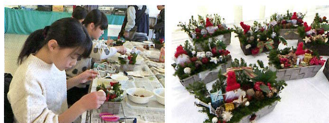
クリスマスボックス