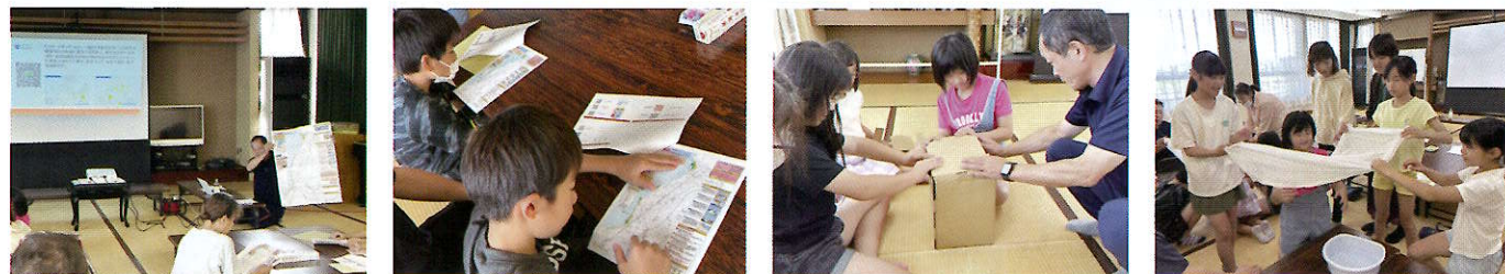
防災について学ぼう