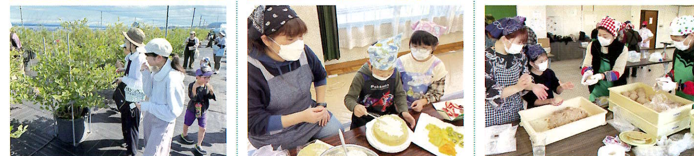
ブルーベリー摘み取り体験