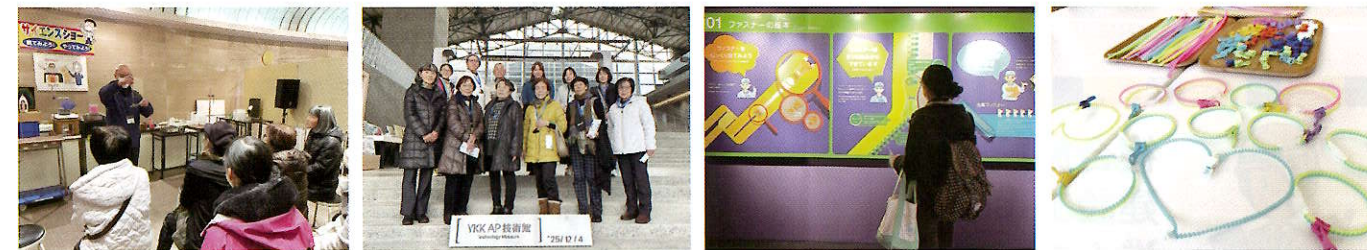
見学会 ~吉田科学館・YKKセンターパーク~