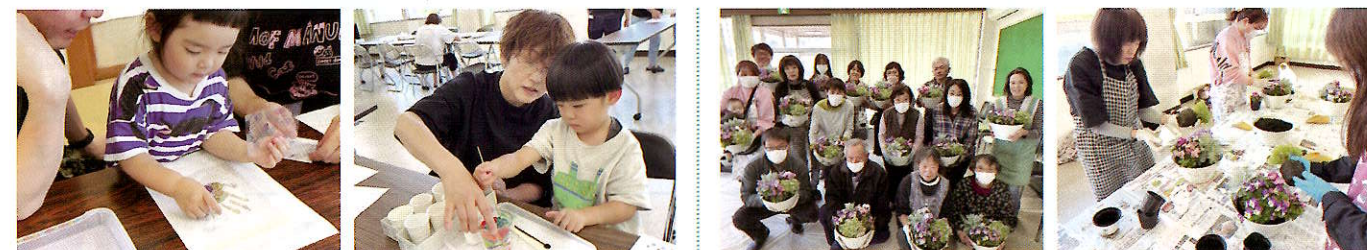
ものづくりワークショップ