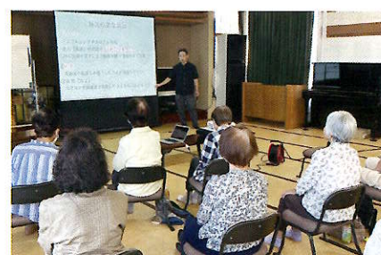
肺炎について ~ゆたかクリニック~