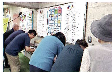
住民運動会での投票の様子

地域のみなさんからの応募、住民投票により、ロゴキャラクター一名が決定しました。かみのがたらしく、親しみやすい名前をつけてもらえたのではないかと思います。これからは「のがたん」も一緒に“かみのがた”の“いいところ”を発信していきます。