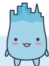
魚津市イメージキャラクター ミラたん