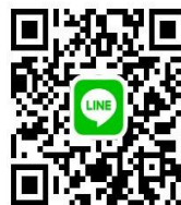
魚津市LINE公式アカウント