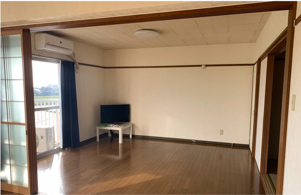
←⑦ 洋室 2