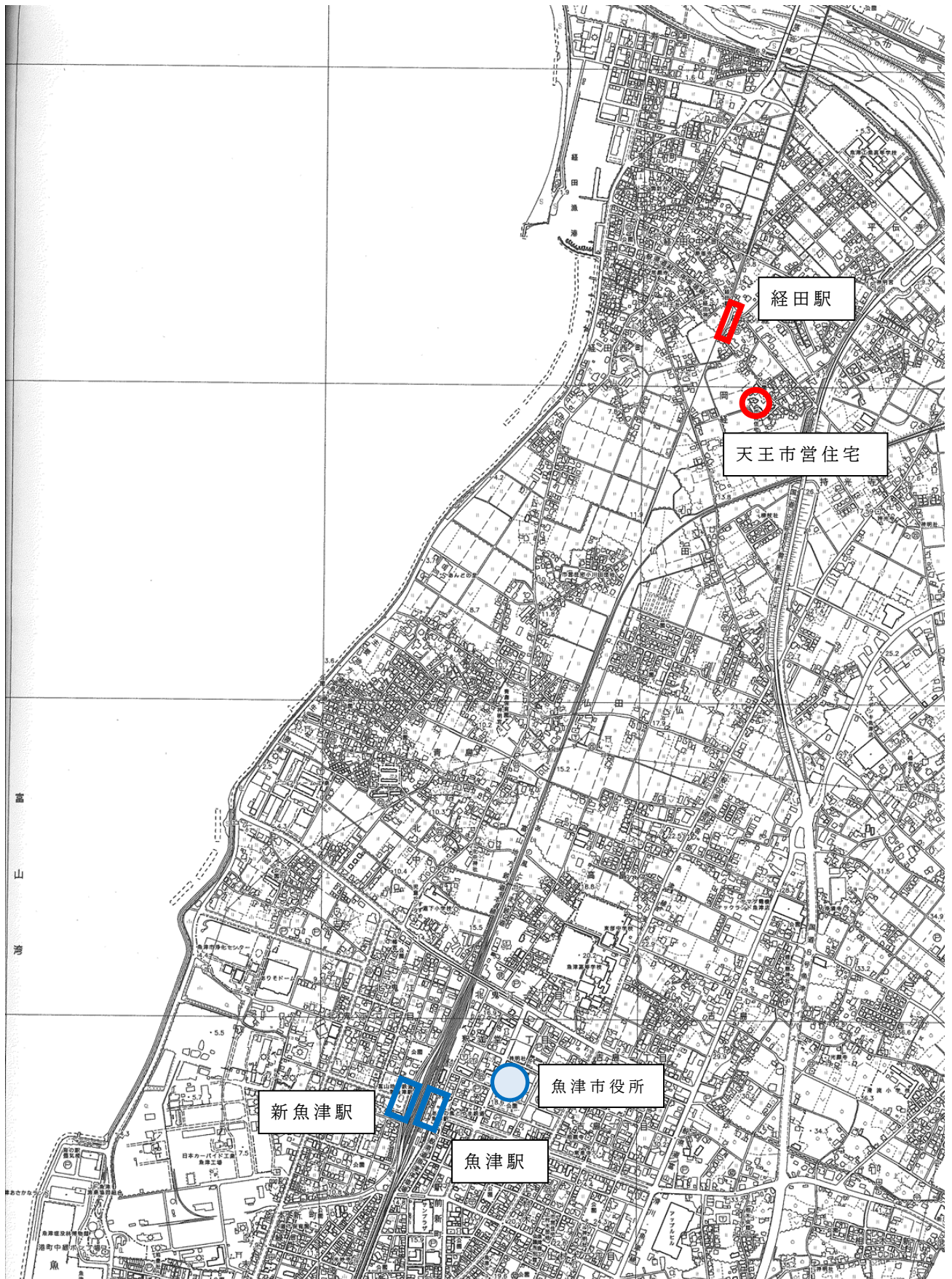
位置図（天王市営住宅）