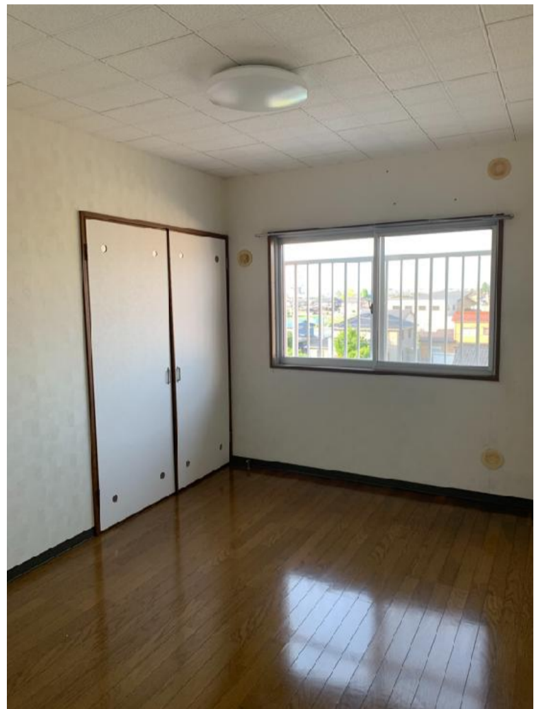
↑⑩ 洋室 1