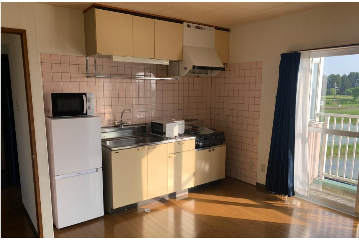
←⑥ ダイニングキッチン