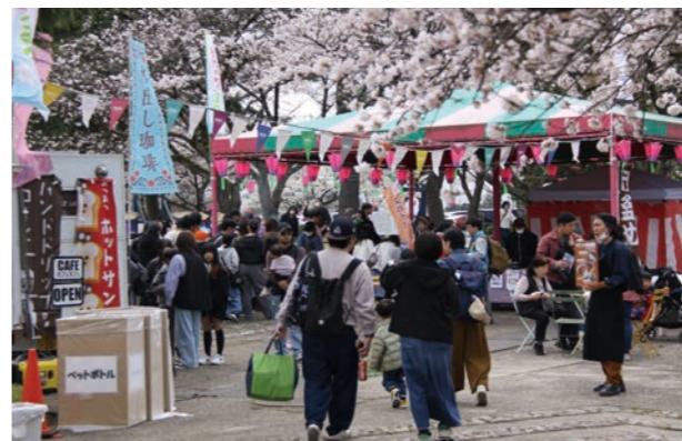
▲飲食ブースで賑わう様子

「魚津市総合公園（愛称：みらパーク）」で、毎年恒例のさくらまつりが開催されました。園内の桜が見ごろを迎え、訪れた市民や観光客を魅了しました。イベント期間は市内外の美味しい名店が勢ぞろいし、行列ができるほどの賑わいを見せていました。また、ストリートダンスや蜃気楼節の熱演もあり、会場を盛り上げました。お花見の後には、魚津水族館やミラージュランドに遊びに行く人も多く、魚津の春を満喫していました。