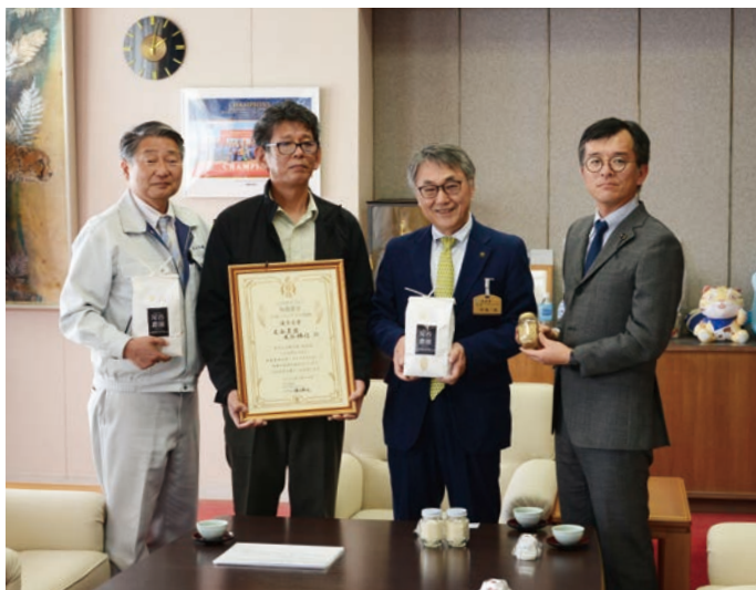
▲受賞後の市長表敬訪問の様子

今年2月14日に行われた「第3回 米冠位 人と自然をつなぐ無農薬米日本一コンテスト」で決勝大会に進出し、全国で4人しかいない優秀金賞を見事に受賞されました。今回の受賞について何うと、「全国トップレベルのお米と評価されたことで、魚津の自然環境の豊かさを証明できたと思う。米作りや農業全体がもっと発展して欲しい」と語られました。