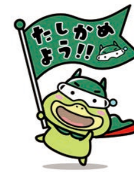
労働基準局広報キャラクター たしかめたん