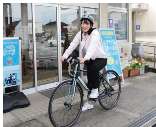
▲魚津駅観光案内所でのレンタサイクル

※4月1日よりレンタサイクル利用料金を改定しました。詳しくは広報4月号16ページまたはHPをご確認ください。