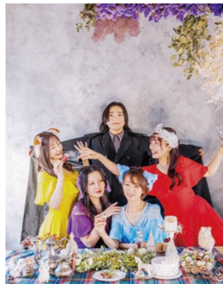
▲アンサンブルユニット「美音 -Mion-」