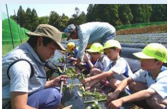
サツマイモ苗植え