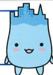
魚津市イメージキャラクター“ミラたん”

【ご相談・お問い合わせ先】 魚津市役所商工観光課 電話（0765）23-6195 / FAX（0765）23-1060 メール syokokanko@city.uzo.toyama.jp